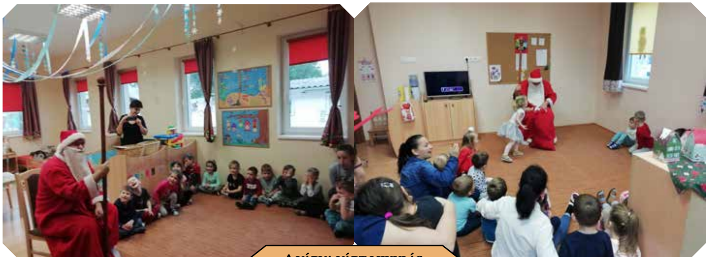
A VÁRVA VÁRT MIKULÁS