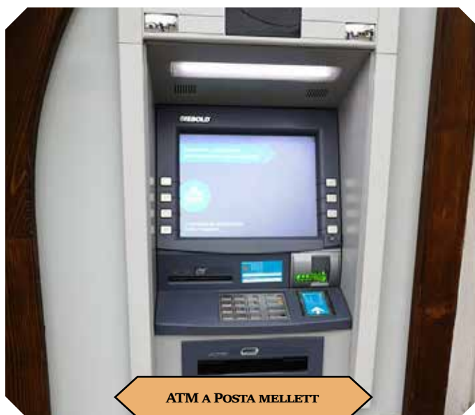
ATM A POSTA MELLETT