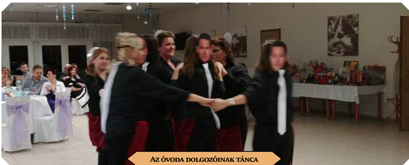
AZ ÓVODA DOLGOZÓINAK TÁNCA