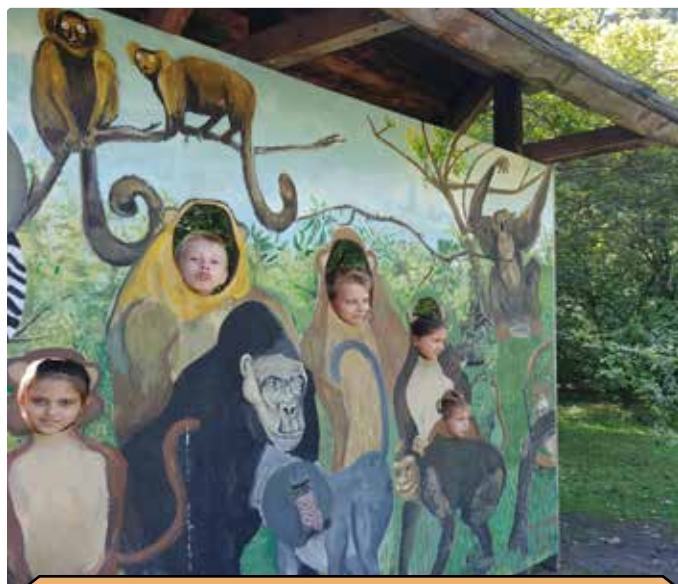
A NAGYCSALÁDOSOK KIRÁNDULÁSA