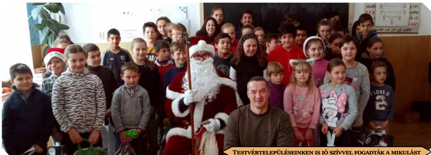
TESTVÉRTELEPÜLÉSEINKEN IS JÓ SZÍVVEL FOGADTÁK A MIKULÁST