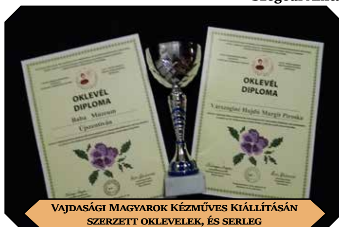
VAJDASÁGI MAGYAROK KÉZMŰVES KIÁLLÍTÁSÁN SZERZETT OKLEVÉLEK, ÉS SERLEG