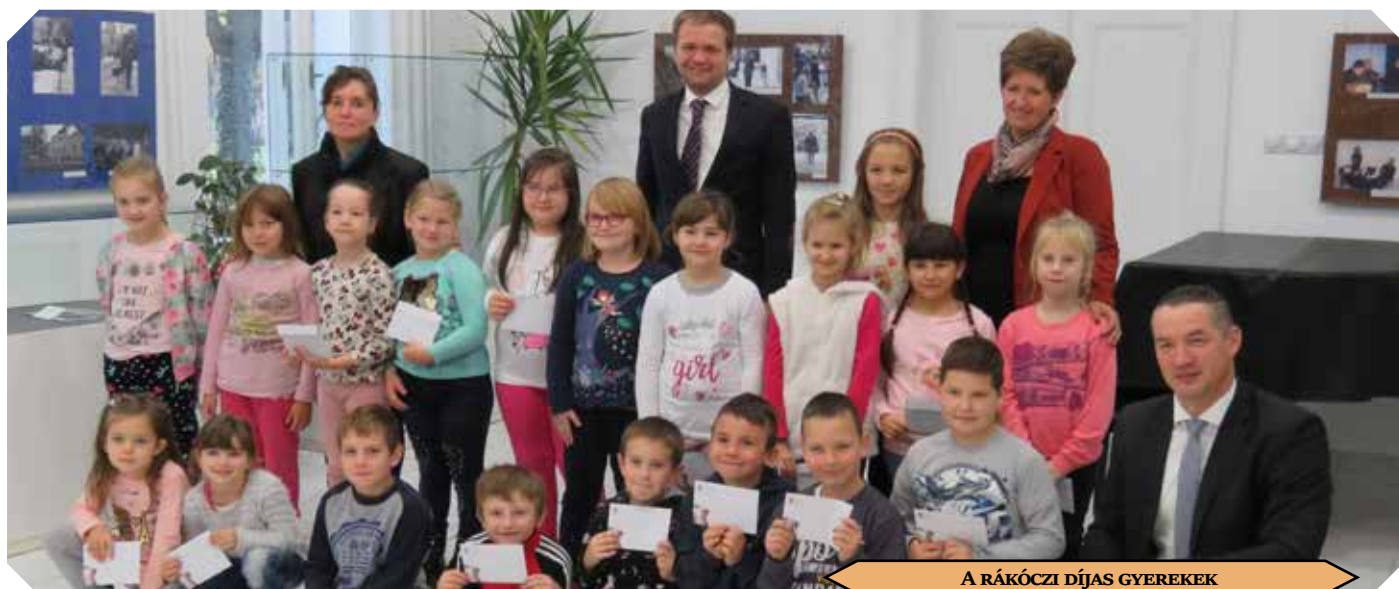
A RÁKÓCZI DÍJAS GYEREKEK