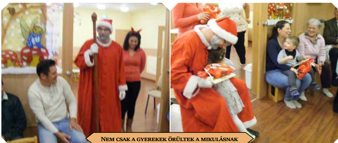
NEM CSAK A GYEREKEK ÖRÜLTEK A MIKULÁSNAK