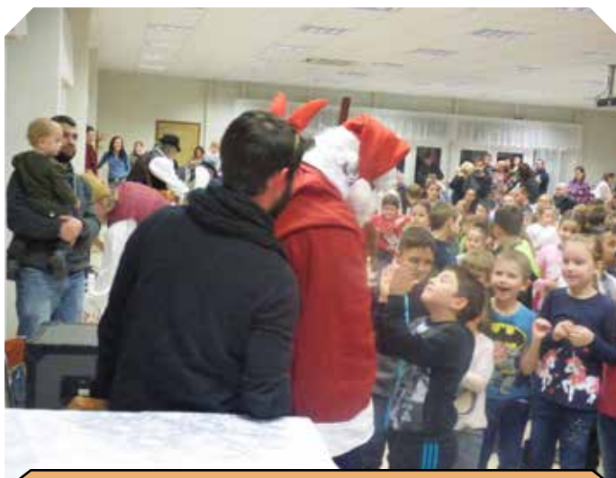
A FALU MIKULÁS ÉS A LELKES GYEREK SEREG